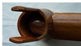
【本体の奥までしっかり差込む】