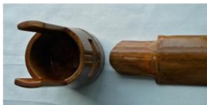
【本体に押え板の取り付け】